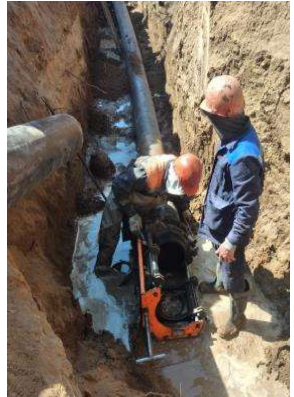
Капитальный ремонт водопроводных сетей на ул. Насыпная